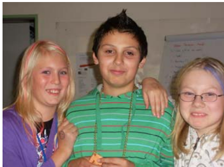
Wie Berlusconi: Der Bürgermeister hängt mit seinen beiden Schnitten ab