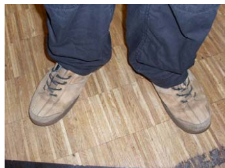
Wer ist das: Der erste von 83 Teilen unseres JumboJum-Starschnitts