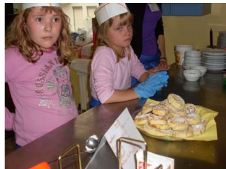
Zum Anbeißen: Verträumte Süßigkeiten in der Bäckerei für 4 Jumbel pro Stück