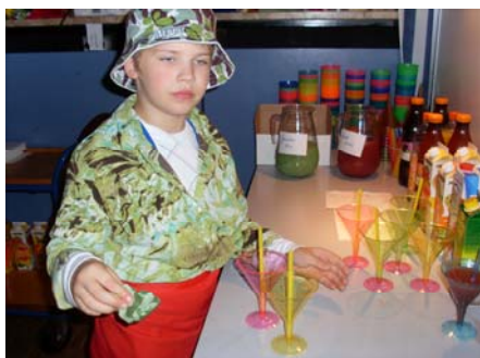
Knallharter Nahkampf-Ausbilder in der Karibik-Bar