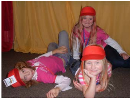
Die Reporter der Zeitung liegen nur auf der faulen Haut rum