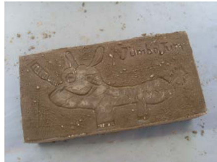
Spielstadt JUMBOJUM: Für die Ewigkeit in Stein gemeißelt